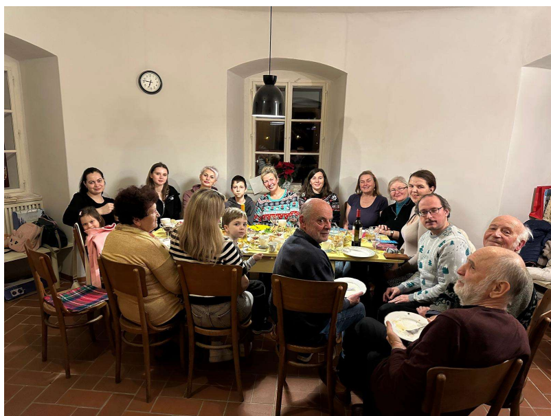
Vánoční večírek v baště.