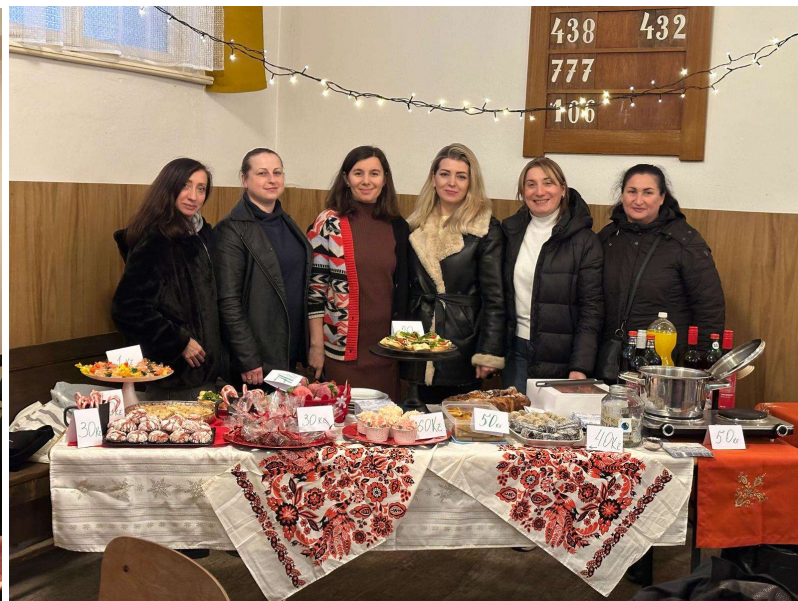
Náš skvělý „Klub ukrajinských žen“ na adventním trhu.