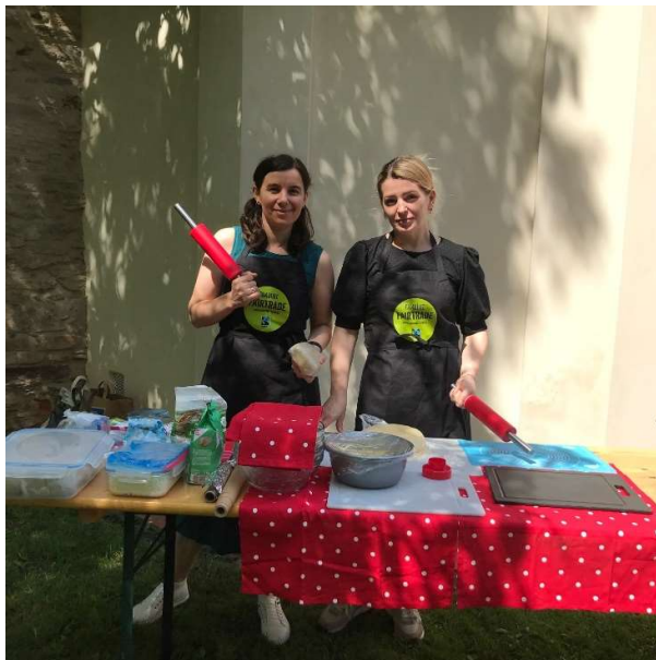
V červnu po bohoslužbách – Den vareniků

Od března 2022 se konají pravidelně jazykové kurzy v baště, i v roce 2024 se konaly každý týden 2x, nyní se už nejedná tolik o kurzy jako spíše hodiny konverzace. V roce 2024 se také konalo mnoho krásných společných akcí (výlety, posezení v restauraci, sborový výlet, velikonoční tvoření aj.). Také byl založen pod Dobročinným spolkem Marta „Klub ukrajinských žen“, který se zapojil do pomoci druhým – výtěžkem z prodeje jejich sladkých i slaných dobrot ženy přispěly Dobročinnému spolku Marta několika tisíci korun, za což jim patří velký dík!!! Volnočasové aktivity ukrajinských uprchlíků byly také v roce 2024 podpořeny granty ČCE, a jsme za to velmi vděční.