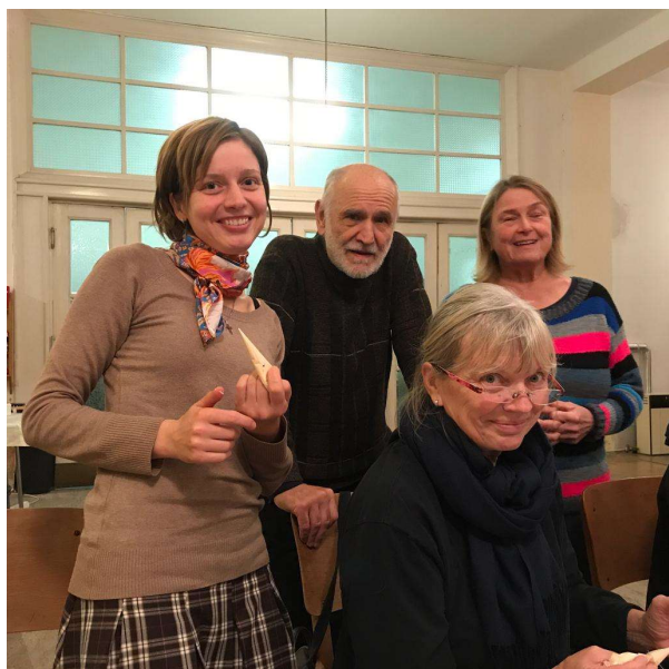
Náš skvělý lektorský tým!

Od března 2022 se konají pravidelně jazykové kurzy v baště, i v roce 2024 se konaly každý týden 2x, nyní se už nejedná tolik o kurzy jako spíše hodiny konverzace. V roce 2024 se také konalo mnoho krásných společných akcí (výlety, posezení v restauraci, sborový výlet, velikonoční tvoření aj.). Také byl založen pod Dobročinným spolkem Marta „Klub ukrajinských žen“, který se zapojil do pomoci druhým – výtěžkem z prodeje jejich sladkých i slaných dobrot ženy přispěly Dobročinnému spolku Marta několika tisíci korun, za což jim patří velký dík!!! Volnočasové aktivity ukrajinských uprchlíků byly také v roce 2024 podpořeny granty ČCE, a jsme za to velmi vděční.