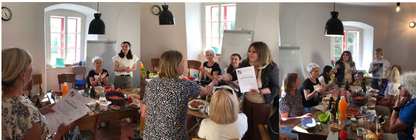
Červnové předávání vysvědčení a slavnost.