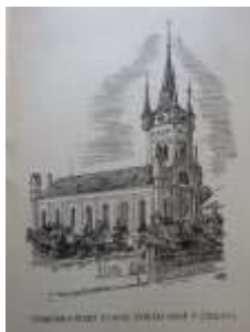
in: brožura cca 1949-1952